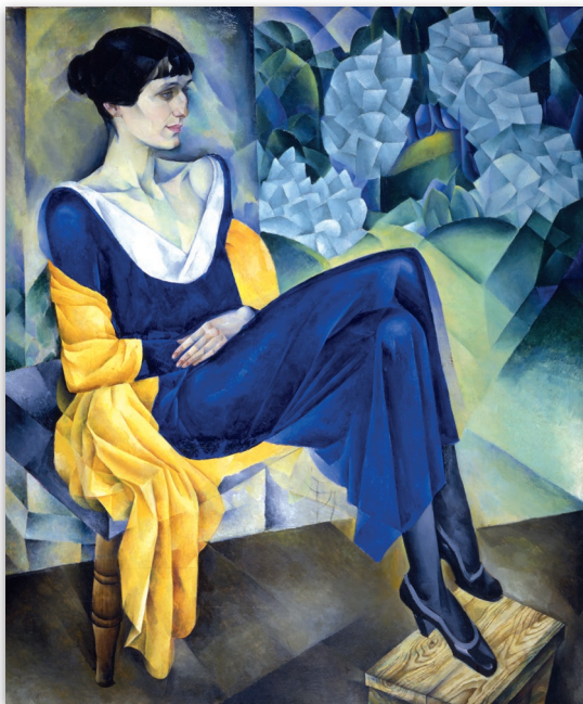
Natan Altman, Ritratto della poetessa Anna Akhmatova , olio su tela, 1915