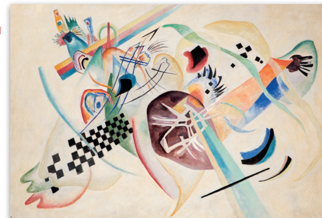
Vasilij Kandinsky, Su Bianco (I) , olio su tela, 1920