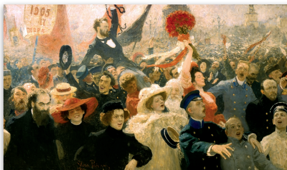
Ilya Repin, 17 Ottobre 1905 , olio su tela, finito nel 1911