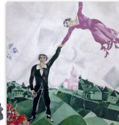
Marc Chagall, Promenade , olio su tela, 1917 © Chagall © by SIAE 2017