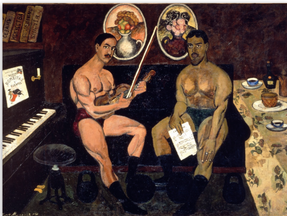
Il'ja Maškov, Autoritratto con Končalovskij , olio su tela, 1910