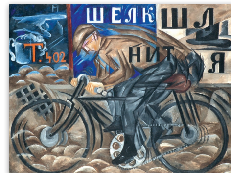
Natalia Goncharova, Ciclista , olio su tela, 1913 © Nathalie Gontcharova by SIAE 2017