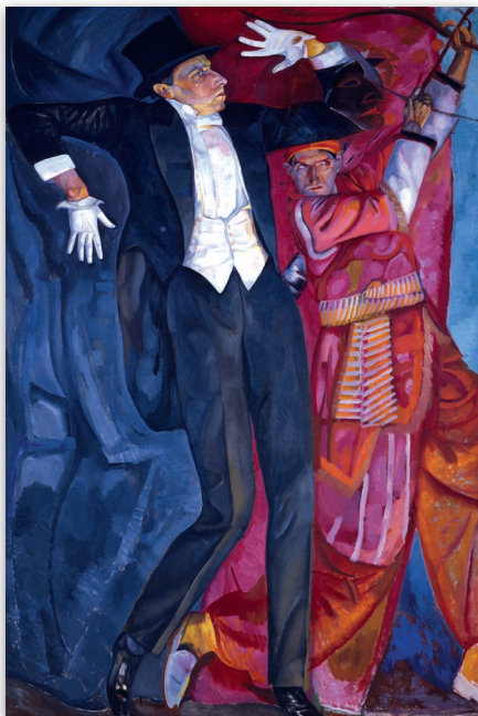
Boris Grigoriev, Ritratto di Mejerhold , olio su tela, 1916