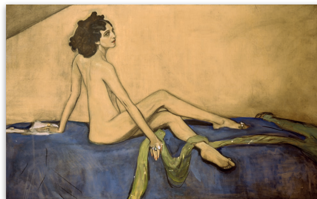
Valentin Serov, Ritratto della ballerina Ida Rubinstein , olio su tela, 1910